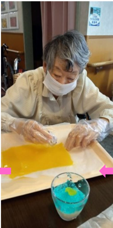
オレンジゼリーをトッピング