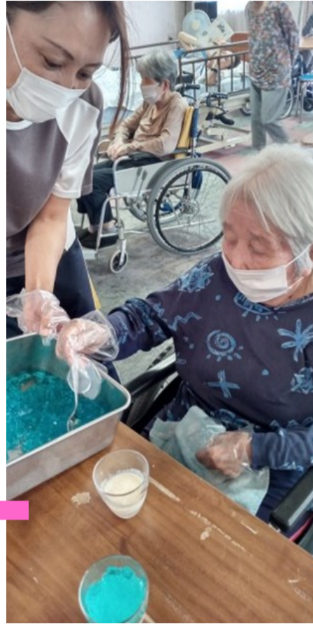
水色ゼリーを盛りつけて

七夕にちなんだ「セタゼリー」を作りました。見た目も涼しげで、さっぱりとした味わいと清らかな食感で暑い日もさわやかな気分。年齢を重ねるとのどの渴きを感じにくくなり、水分が不足がちになっってしまうますが、これならどんどん進みそう！と、皆さまご満足のご様子。ですが、暑いからと言って冷たい物の摂り過ぎは、体によくありませんので、気を付けて下さいね。