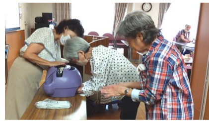
手洗いチェッカー

ボードや模型を用いてわかりやすく説明し、嚥下機能低下に備えて服薬ゼリーを使用して楽に飲む体験等も実施しました。在宅で役に立つ内容満載で良かったと好評をいただきました。皆さま、ご参加ありがとうございました。次回もこうご期待。