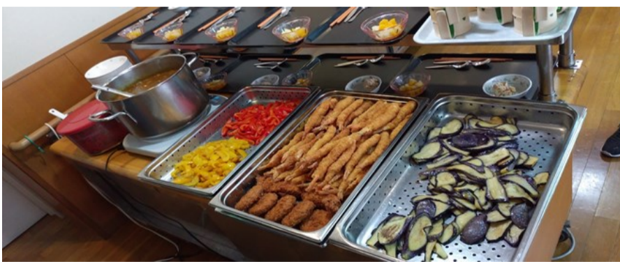
豪華やなあ~いくら?