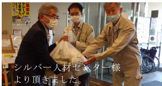
シルバー人材センター様より頂きました。