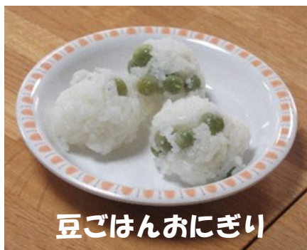
豆ごはんおにぎり

五月は『豆ごはん』でした！えんどう豆は、デイサービスフロアの南側、日当たりの良い窓の外のプランターで育てました。たくさん生った房の収穫をお願いすると、とても手際よくひとつひとつ茎からちぎってドンドンかごに入れて下さいます。たくさん葉っぱの影になっていて職員が見落としていた房も「ここにあるね」「ここに生っているよ」とひとつ残らず収穫して下さいました。収穫できた房をむいて豆を取り出して頂き、お米と一緒に炊き上げると、とても香りのいい豆ごはんが出来上がりました。新鮮な豆から作った春の香りいっぱいの豆ごはんは皆様に大好評！この夏もたくさん美味しく楽しい時間を過ごして頂けるように企画しています。次は何を育てるかもどうぞお楽しみに！