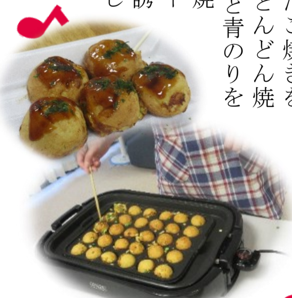
みんな大好きたこ焼き

新型コロナウイルス感染症対策の為、各施設では感染対策をしながらご生活に彩をと工夫をこらして行事を行っています。ホームページの施設ブログの中でもご様子をお伝えしております。是非ご覧下さい。