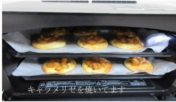
キャフメリゼを焼いています