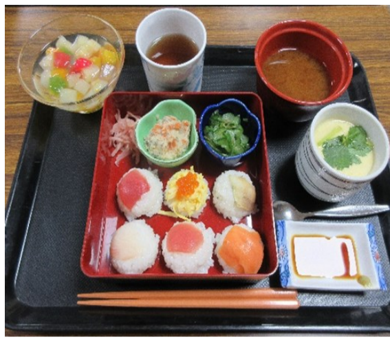
スペシャルランチ てまり寿司