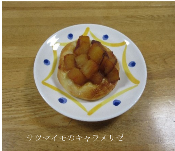
サツマイモのキャフメリゼ

デイサービスでは、食欲の秋が満載です！十月は「鯛めし御膳」や「揚げたてあんドーナツ」、十一月は「てまり寿司」、笑流食堂では「サツマイモのキャフメリゼパン」を作りました。秋晴れの日、中庭で焼いたアツアツの焼き芋は、今年も大好評でした！少しずつですが新型コロナの感染拡大状況を鑑みながら、ご利用者さまと一緒に作れるように工夫しています。十二月の笑流食堂は「ピザパン」です。ふっくら一次発酵が終わったパン生地思い思いに具材をトッピングして焼き上げ、焼き立てをおやつに召し上がって頂きました。これから美味しいしあわせな時間を楽しんで頂けるように頑張っていくます。