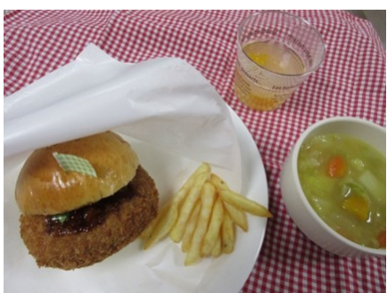
コロツケバーガー