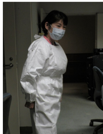
※ご寄付頂いた防護服

世界中が新型コロナウイルスの脅威におびえ、緊急事態宣言が解除された今も高齢者福祉施設では、感染リスクが非常に高い状況が続いています。この度、政府より、感染拡大を予防するための「新しい生活様式」が必要として、具体的な実践例が公表されました。その一つとして、外出時、屋内にいる時や会話をしている時、症状がなくてもマスク着用を求めています。暑い夏に向けて「熱中症への注意」が必要です。マスクが顔のぬくもりと吐く息による加湿で温められ、体に熱がこもってしまい、熱中症への危険が高まります。一時間に一回程度、水分をしっかりとってください。野外で人と十分な距離（二メートル以上）を確保できる場合には、マスクを外しても大丈夫です。 また、エアコンを使用しますが、多くのエアコンには換気機能がありません。窓を開けて一時間に一回五分程度換気を行いましょう。 毎朝体温測定、健康チェックをし、発熱、かぜの症状がある場合は、無理せず自宅で療養しましょう。 感染防止の三つの基本は、①身体的距離の確保（ソーシャルディスタンス）②マスクの着用③手洗いです。当施設でも職員一同、コロナウイルスを持ち込まないよう最大限の感染予防に努めております。 ご家族の皆様には、ご不便やご不自由をおかけいたしますが、ご理解とご協力をお願い申し上げます。皆様、笑顔でお元気においでできる日を楽しみにしております。